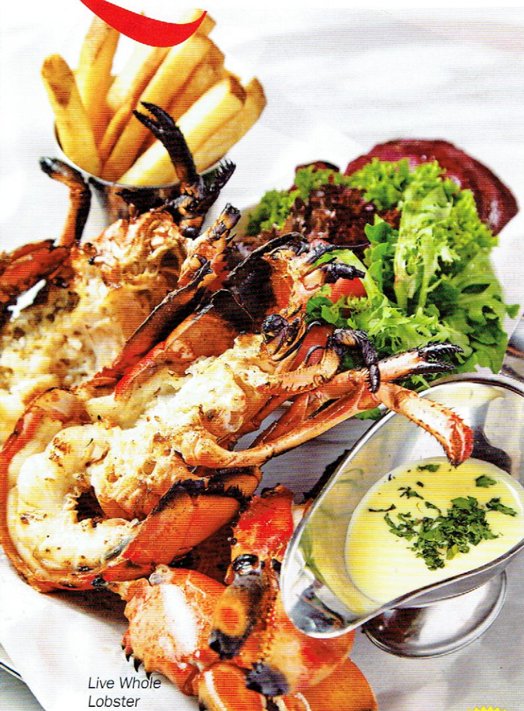
Live Whole Lobster

Jika kamu peminat setia udang karang, kunjungan kamu ke sini pasti tidak menghampakan kerana setiap hidangan menyajikan seekor lobster dengan anggaran berat 600 gram hingga satu kilogram. Menu lobster di Pince & Pints agak terhad tetapi ia mementingkan kualiti dalam setiap hidangan. Apa yang istimewa di sini? The Lobster Roll pasti buat kamu di awang-awangan dengan kombinasi sos garlic aioli serta perahan lemon. Untuk sajian Live Whole Lobster , kamu boleh pilih cara udang karang dimasak sama ada panggang atau rebus. Sajian ini dihidang bersama salad, kentang goreng dan sos mentega herba. Sajian signature dari Singapura iaitu Chilli Lobster menggunakan ramuan seperti tomato roma, cili, serai, bawang putih dan telur untuk sos, cukup sesuai dimakan bersama roti kukus mantou . Setiap hidangan berharga RM158. Untuk minuman, Cosmo cadangkan minuman khas iaitu Bangsar Mule gabungan jus oren, limau nipis, pudina dan sirap halia. Sangat refreshing !